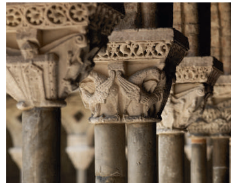
修道院的柱头 © 多米尼克·维耶特