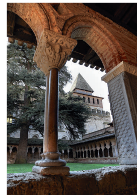
Cloître de Moissac

在装饰修道院的76个柱头中，超过一半被称为“历史”，因为他们的装饰评论了圣经的情节或圣徒的生活。其他被称为“装饰”的东西则唤起人们对创世纪的记忆。在西面的画廊中，中央支柱的大理石板上的记载表明这座罗马式修道院是1100年完工的。最后四行字母的意义至今仍然密不可知。